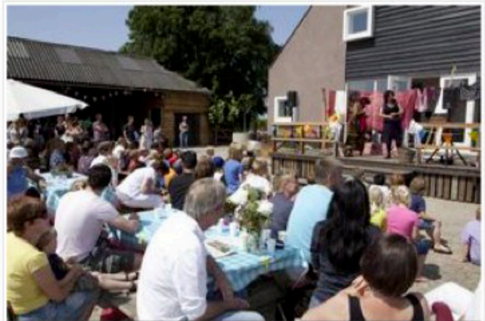
Tijdens het openingsfeest bij de logeerboerderij werd er voor de kinderen ook een toneelstukje opgevoerd.

Bergwerff hoopt dat de minicamping dit jaar van de grond komt en de gezinnen willen binnenkort starten met dagopvang voor kinderen met een beperking. "Er zijn nog zoveel plannen en dat om een reden: iets terug doen voor God".